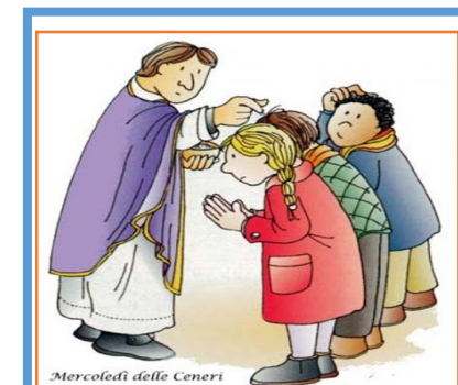
Mercoledì delle Ceneri

Che può avere risvolti positivi. Viene in mente un proverbio: " Non tutti i mali vengono per nuocere ". E' indiscutibile quanta sofferenza stia causando questo virus, a tutti i livelli: personali, economici, medici. Paure, sospetti, circospezioni, fobie, rotture di rapporti, insicurezze. Niente di buono, e chissà fino a quando. Costretti, perché non cerca, a una condizione di isolamento. Sei chiamato a reinventare nuove abitudini. Cominci ad accorgerti che coloro con i quali condividi la vita sono importanti, ricuperi la bellezza del parlare e dell'ascoltare. Trovi in loro la sincerità dei rapporti, difficili nei molteplici incontri abitudinari. Ti rendi conto che si può vivere bene anche senza tante cose che ti sembravano importanti e non lo erano ( magari anche costose )...se ne può fare a meno, a favore di più tempo per pensare, per stare insieme. Hai più tempo per capire che siamo fragili, per accorgerti che la natura che ti circonda è qualcosa di meraviglioso, che va difesa perché è un dono. Forse nasce il bisogno di pregare, di ringraziare. ( firmato )